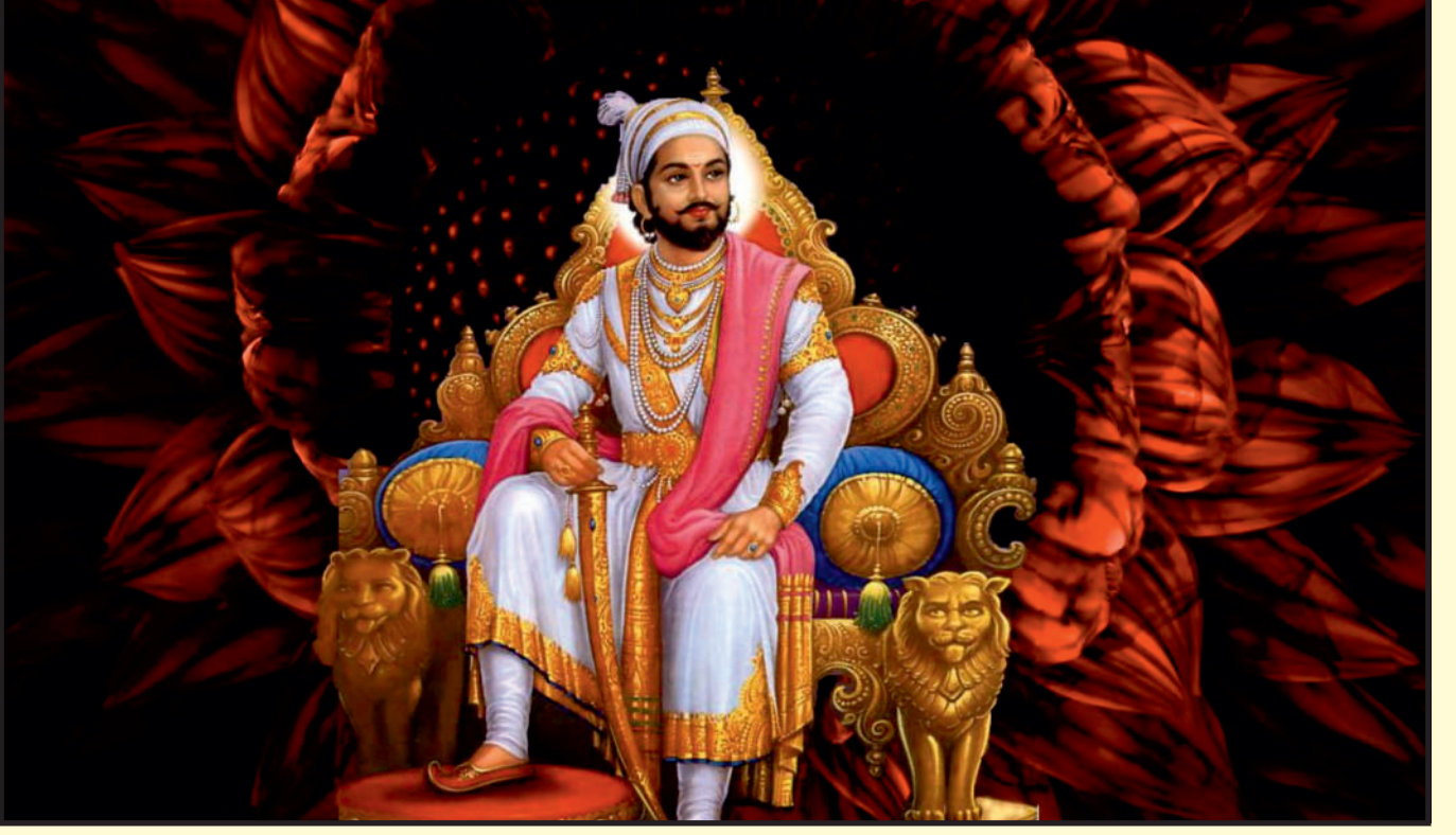
छत्रपत्री शिवाजी महाराज