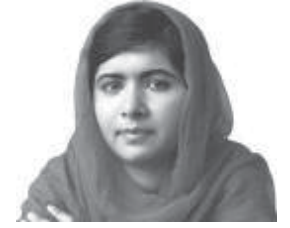
कु. यूसूफझाई मलाला

प्रदीर्घ काळापासून मुलांच्या हक्कांसाठी लढा देणाऱ्या कैलाश सत्यार्थी यांच्यासोबत हा पुरस्कार मिळाल्याचा मला सार्थ अभिमान आहे. माझ्या वयाच्याही दुप्पट इतकी वर्षे त्यांनी लढा दिलेला आहे. आम्ही एकत्र लढा देऊ शकतो याचा मला अभिमान आहे. आम्ही जगाला दर्शवू शकतो की एक भारतीय व एक पाकिस्तानी व्यक्ती एकत्रितपणे लढा देऊन मुलांचे हक्क मिळवून देण्याचे ध्येय साध्य करू शकतो.