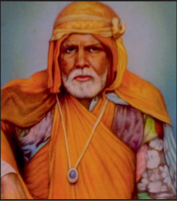
संत गाडगे महाराज